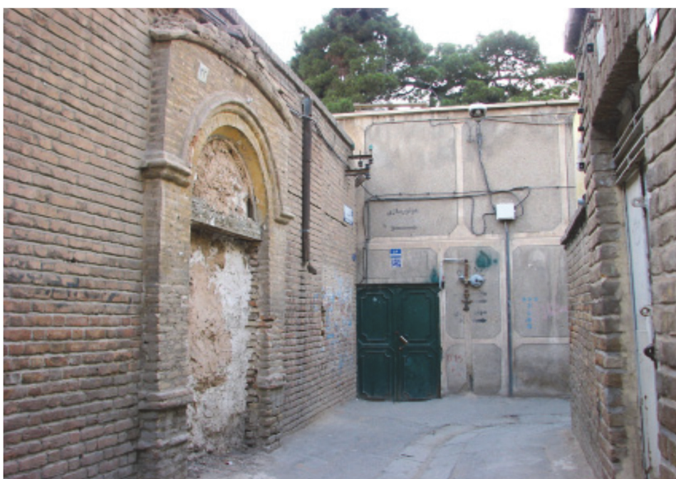
شکل ۲. تخریب تزیینات بنا توسط مالک ب همنظور جلوگیری از ثبت (Rezaei 2014)

خانه خود را به گروه های مهاجر یا کارگاه های تولیدی فروخته یا اجاره دادند و خود به محل دیگری نقل مکان کردند. برخی دیگر که توانایی نقل مکان به محله یا مسکن نوساز دیگری را نداشتند، در خانه های قدیمی خود ماندند، بدون اینکه اقدامی برای مرمت و نگهداری آن کنند. [۶] بی توجهی مالکان به حفاظت و نگهداری از بناهای قدیمی، استقرار گروه های مهاجر (که نه به محله تعلق خاطر داشته و نه توانایی مالی برای نگهداری بناها داشتند)، ایجاد کاربری های ناسازگار به ویژه کارگاه های صنعتی، موجب فرسودگی روزافزون بناها شد. در موارد معدودی، سازمان